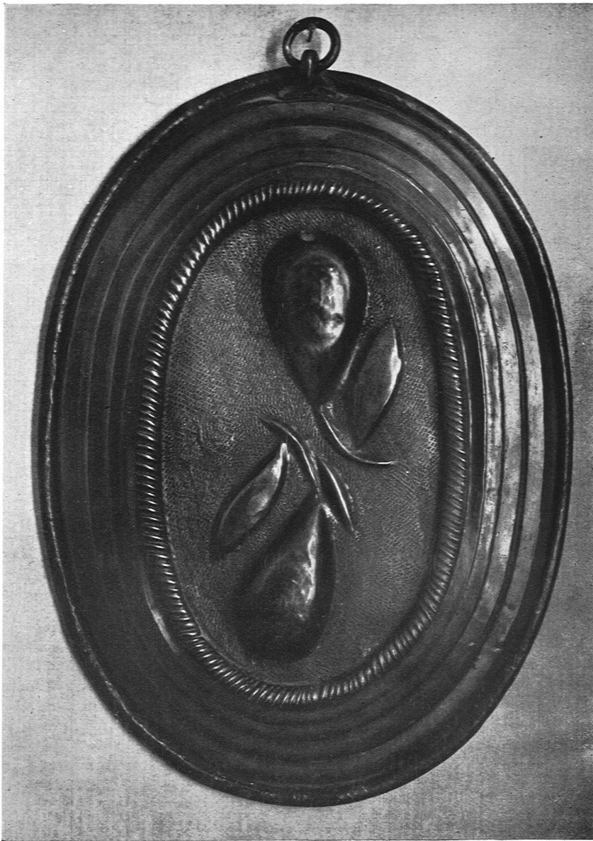
Kupfergerät aus der Sammlung Guggenheim, Baden, Ausstellung im Kunstgewerbemuseum Zürich

stellung der Ermordung eines Heiligen kam es dem Künstler mehr darauf an, deutlich zu machen, daß der fromme Mann mitten im Gebet hingemordet wurde, als zu zeigen, in welcher Weise und mit welcher Gebärde er auf das ihn durchbohrende Schwert reagierte. Da beides, Gebet und Schreckensgebärde, in einer Figur nicht darzustellen ist, so wählte der primitive Künstler das wesentliche Moment, das Symbol, während ein neuerer Künstler sicher das zufällige Moment, die naturalistische Gebärde gewählt hätte. Und es ist die Frage, wer wohl am besten den Kern der Darstellung getroffen habe, der primitive oder der