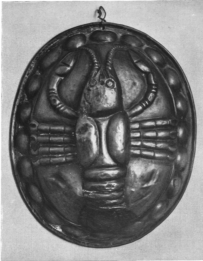
Kupfergerät aus der Sammlung Guggenheim, Baden, Ausstellung im Kunstgewerbemuseum Zürich

nur einen Augenblick aufrichten könne, wie jener Krieger von der linken Lünette des Marignanobildes es fertig bringt, und noch die Fahne hält, so sahen sie durch ihren Dünkel hindurch nicht das Symbolische der Figur, die zum Schönsten gehört, was Hodler geschaffen hat. Und sie meinten, sie hätten ein für allemal diese Darstellung durch diesen Einwurf abgetan. Dieser grau-bärtige Krieger, der im Sterben noch die Fahne hält, ist ein Symbol der Treue, mag die wissenschaftliche Möglichkeit vorhanden sein oder nicht.