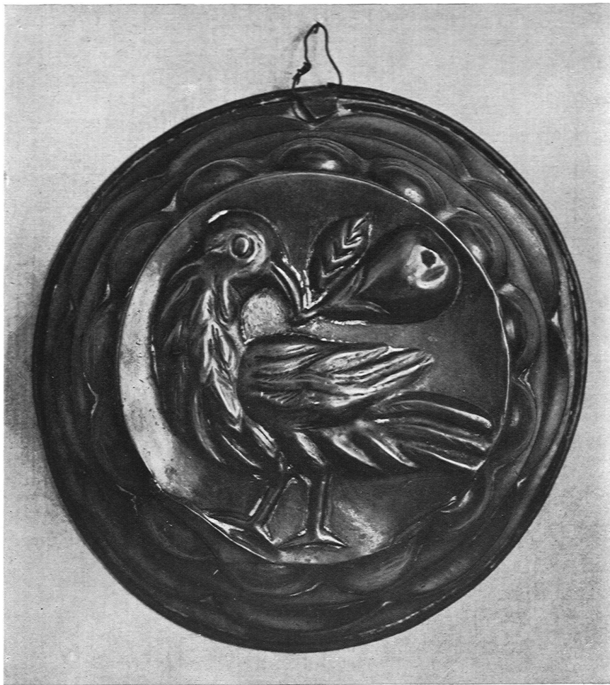
Kupfergerät aus der Sammlung Guggenheim, Baden, Ausstellung Kunstgewerbemuseum Zürich

dieser Stelle betont. Wir sehen uns deshalb nicht veranlaßt, in einem Nachruf auf seine Bedeutung hinzuweisen, vielmehr wollen wir uns freuen ob einem naturgemäßen Geschehnis: Man ruft ihn, wie man alle tüchtigen Kräfte aus der Diaspora herbeiholt, um ehrlich von innen heraus aufzubauen, und er wird mit Zuversicht aufrichten helfen. Wir ehren ihn mit einem abgerundeten Stück aus seinem Buch: Zeichnung, Holzschnitt und Illustration.