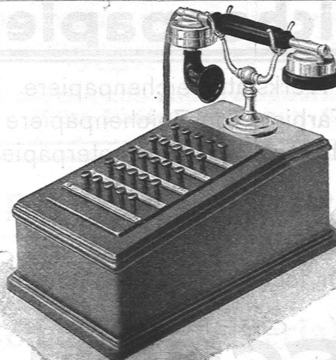
Tischstation zu 25 Anschlüssen