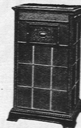
Elektrischer Accumulierofen „Primulus“

„Primulus“ Elektr. Accumulier-Oefen in diversen Grössen und Konstruktionen