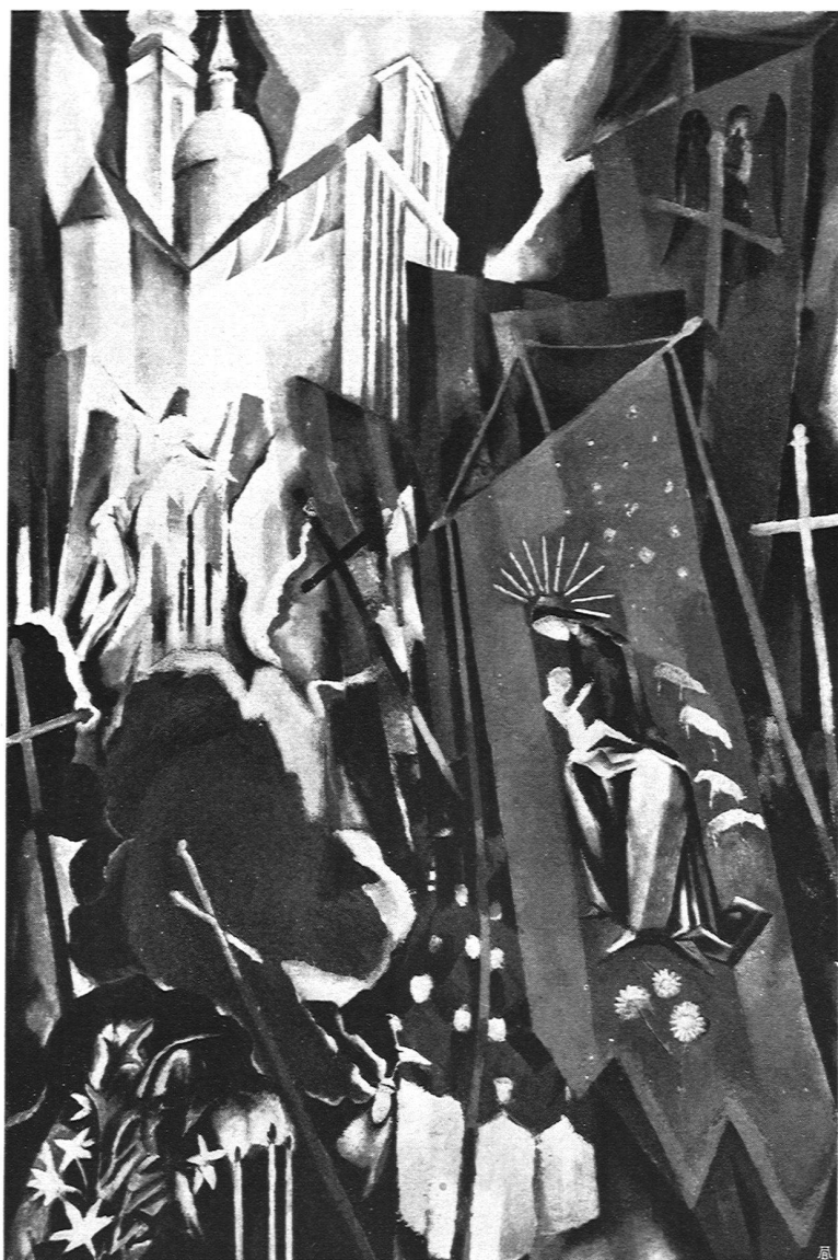
Prozession 1918