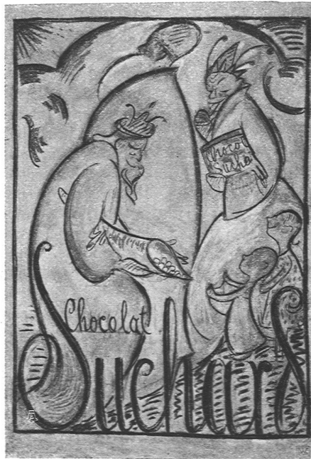
Plakat-Entwurf aus den Werk-Wettbewerben von E. Morgenthaler