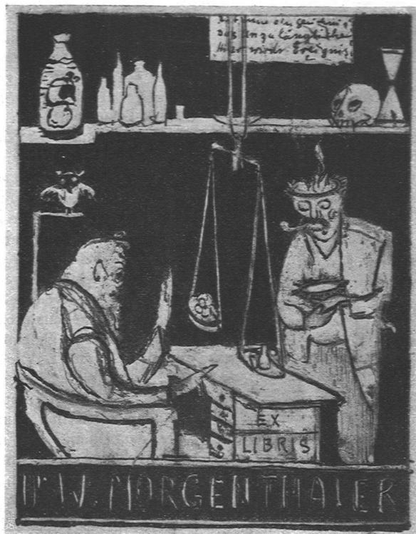
Exlibris für einen Irrenarzt von Ernst Morgenthaler

Zusammenstellungen bieten Annehmlichkeiten, für die sehr viele Gelehrte und Sammler dankbar sind. Wenn wir dazu noch bemerken, daß die beiden Erscheinungen im Text und im Inseratenteil in gleicher Weise sachlich vorzüglich aus den Ehmke-Typen und -Einfassungen gesetzt sind, so dürften sie einer weitgehenden Beachtung empfohlen sein. H. R.