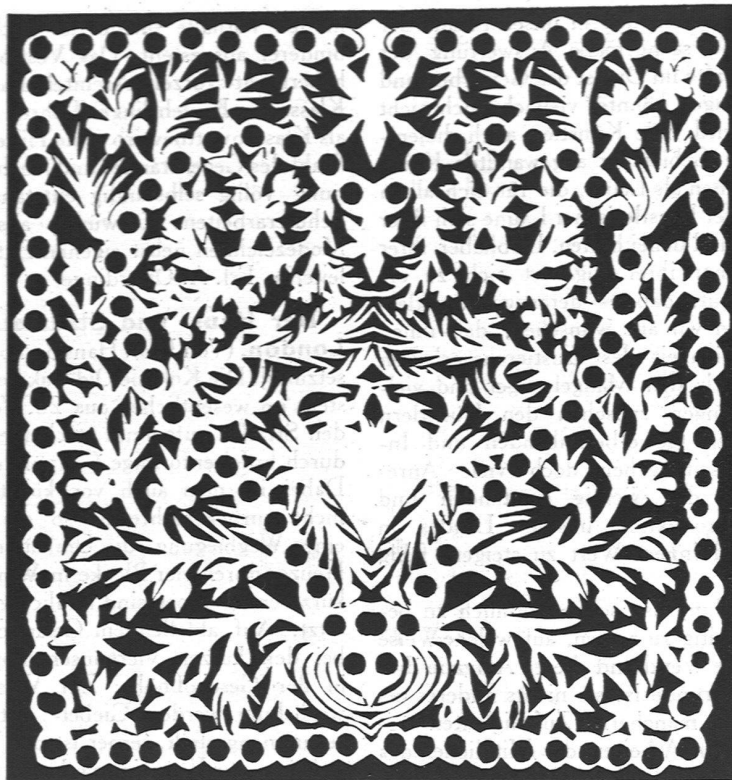
Gefalzter Scherenschnitt XVIII. Jahrhundert

die wir gesehen haben, sind diese Hinweise unbeachtet geblieben. Ebenso ist uns aufgefallen, daß die Anlage der Straßen und die Stellung der Hausgruppen auf die Geländebedingungen sehr wenig Rücksicht nimmt. Dies gegenüberliegenden Hausgruppen stehen oft in verschiedener Höhe, vielfach liegen die Bauten tiefer als die Straße. Die Hauskörper weisen eine außerordentlich geringe