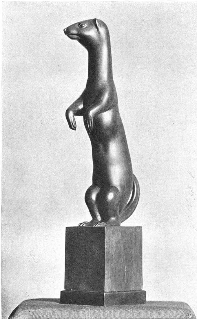
Gewerbeschule der Stadt Zürich, Klasse für Modellieren Lehrer: Carl Fischer