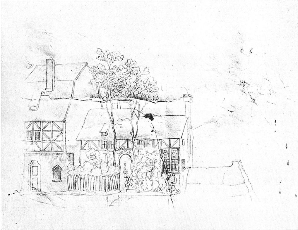
Gottfried Keller, Karton einer mittelalterlichen Stadt