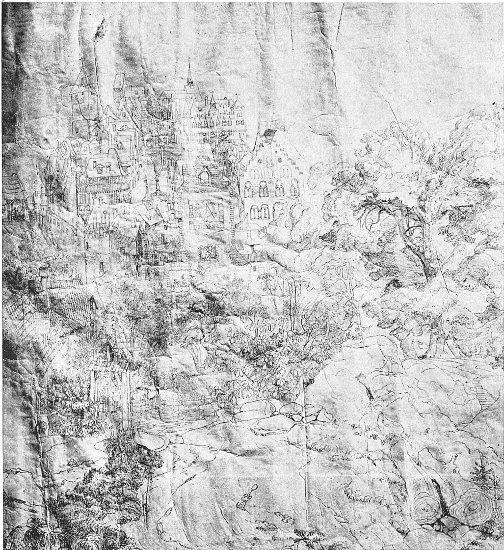
Gottfried Keller, Karton einer mittelalterlichen Stadt