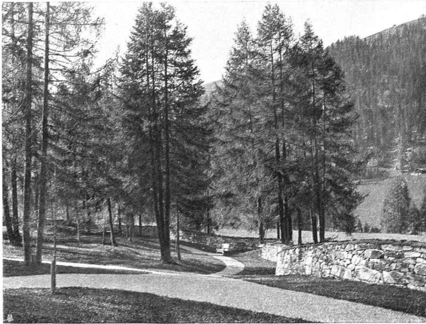
Waldfriedhof Davos, Blick in die Nordwestpartie der Umfassungsmauer