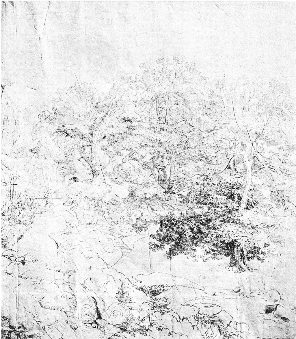
Gottfried Keller, Karton einer mittelalterlichen Stadt