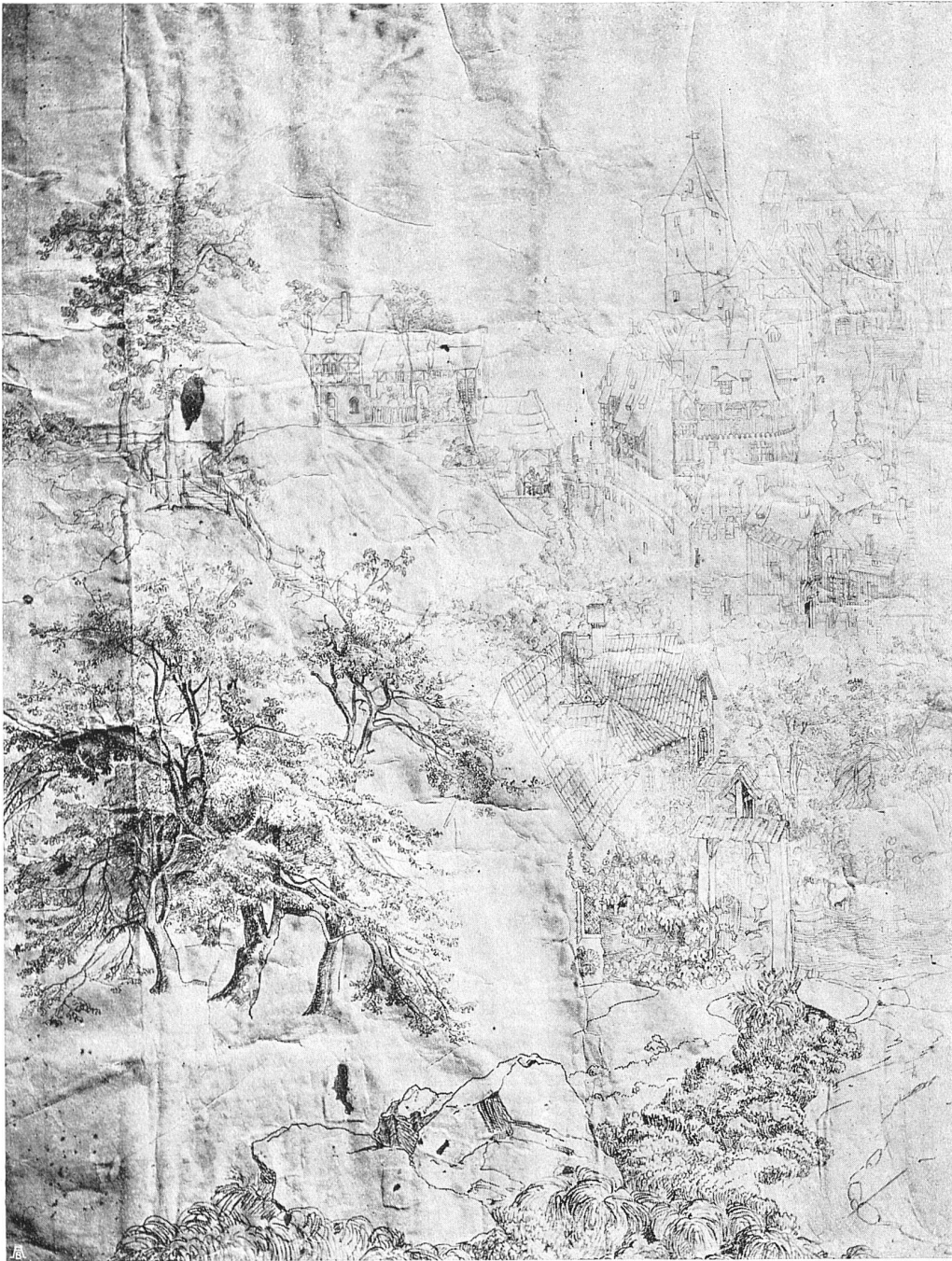
Gottfried Keller, Karton einer mittelalterlichen Stadt