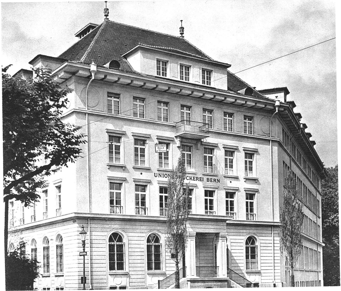
ABB. 3 SÜDFASSADE