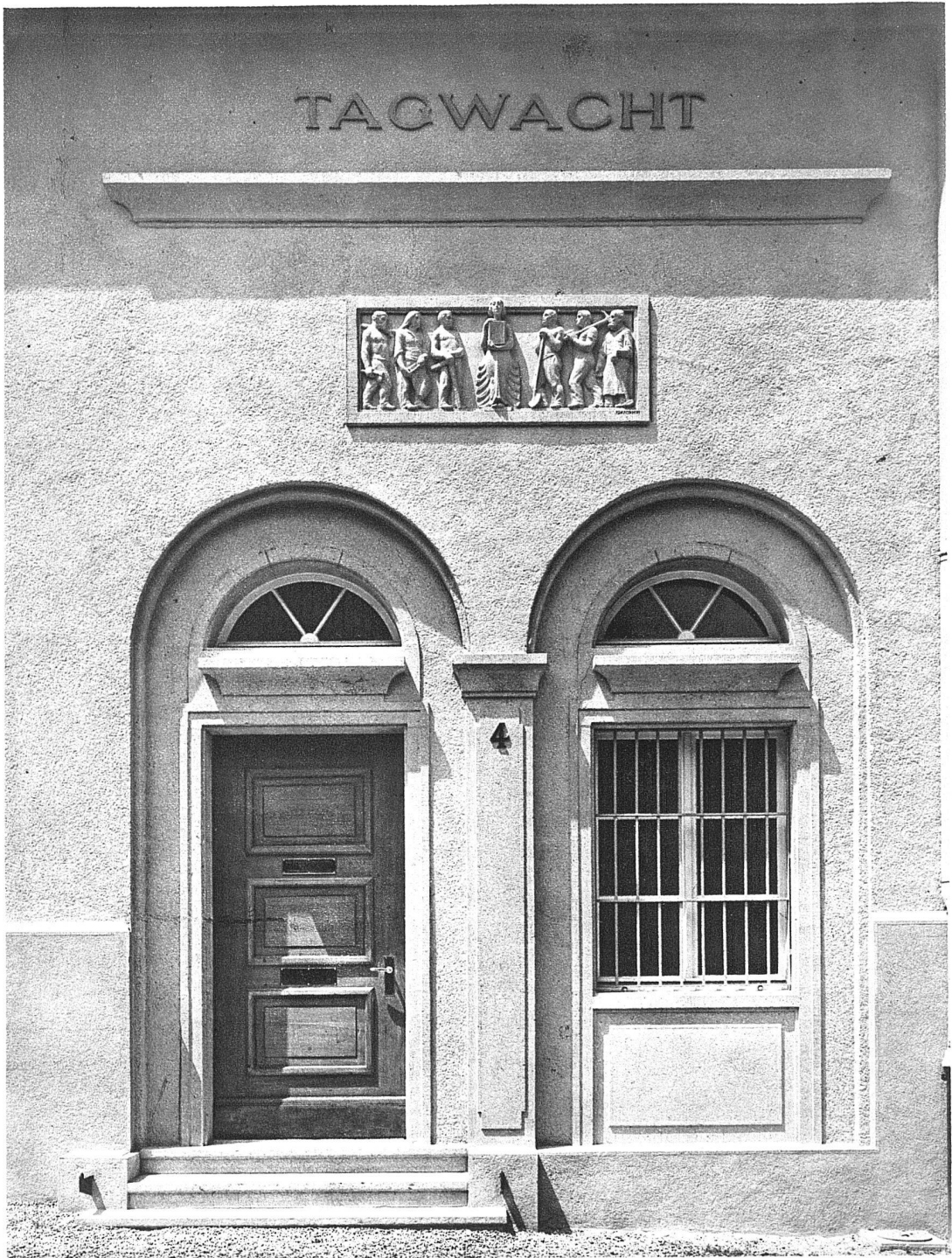
ABB. 5 EINGANG ZU DEN REDAKTIONSBUREAUX RELIEF VON ETIENNE PERINCIOLI, BERN