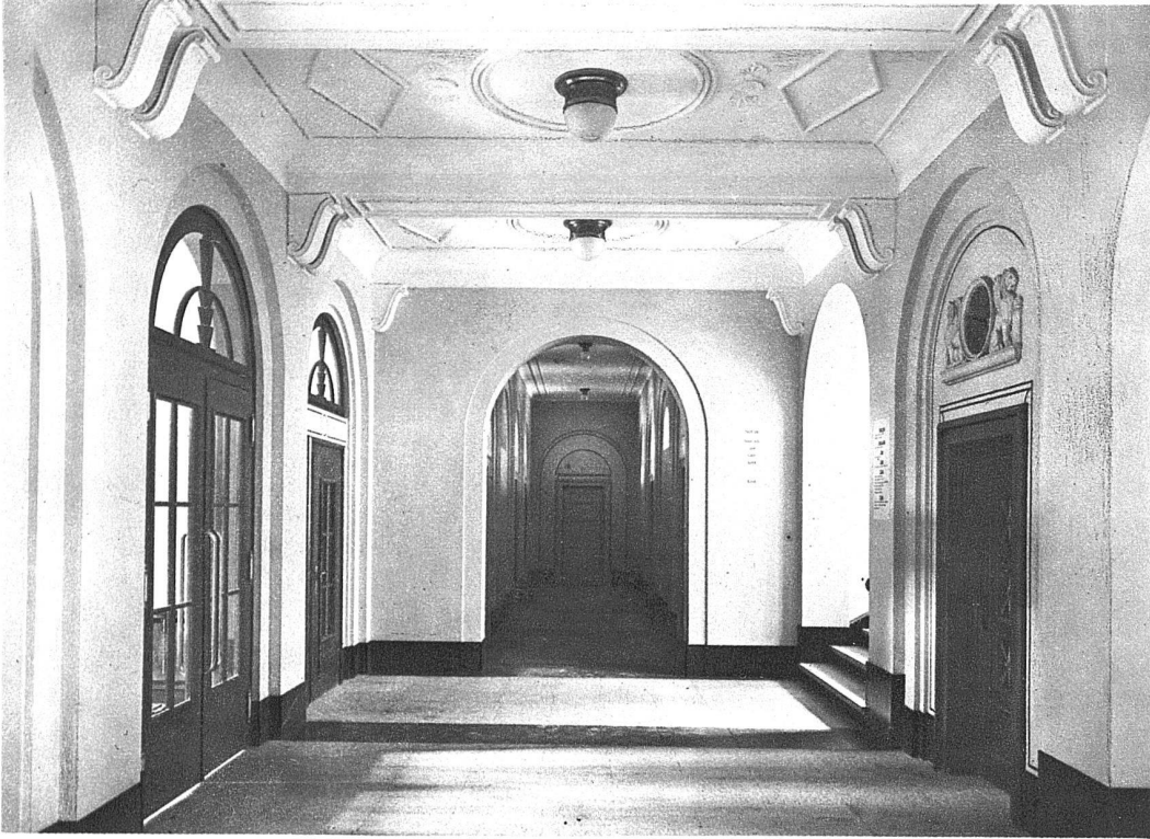
ABB. 8 UND 9 EINGANGSHALLE IM PARTERRE UND ANSICHT IM TREPPENHAUS