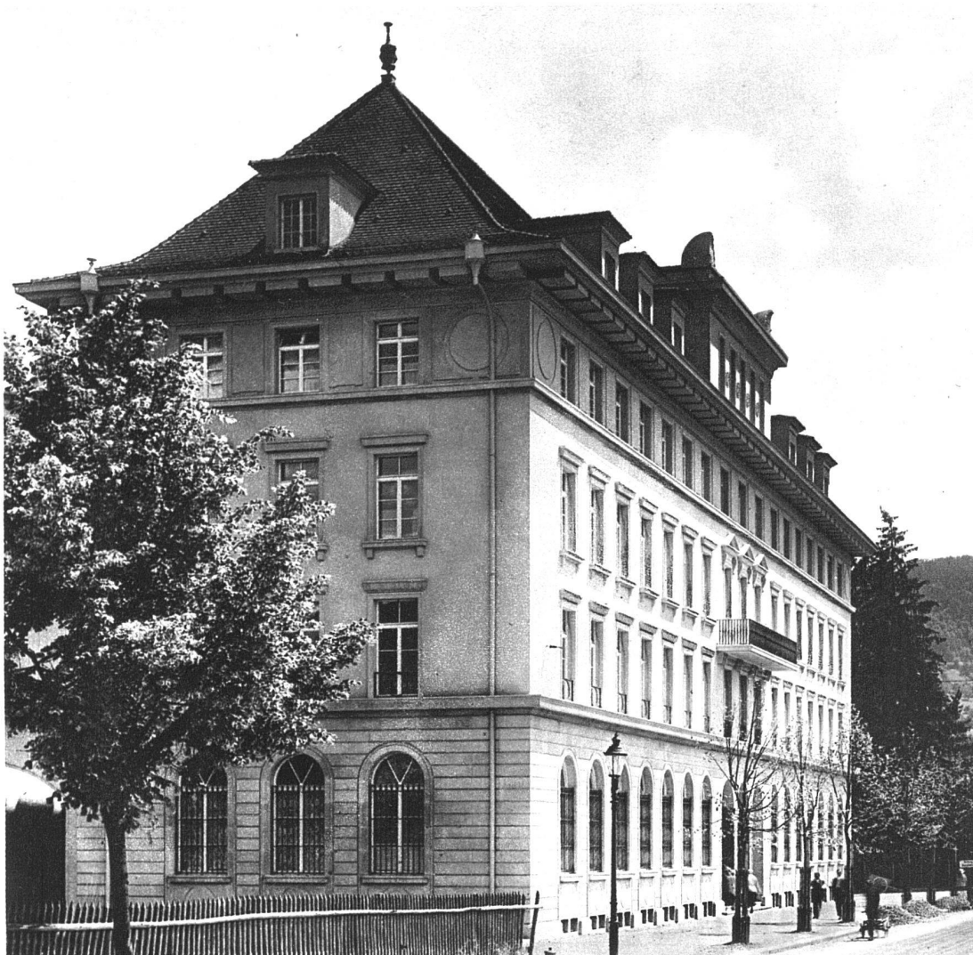
ABB 2 GESAMTANSICHT DES VERWALTUNGSGEBÄUDES AN DER MONBIJOUSTRASSE