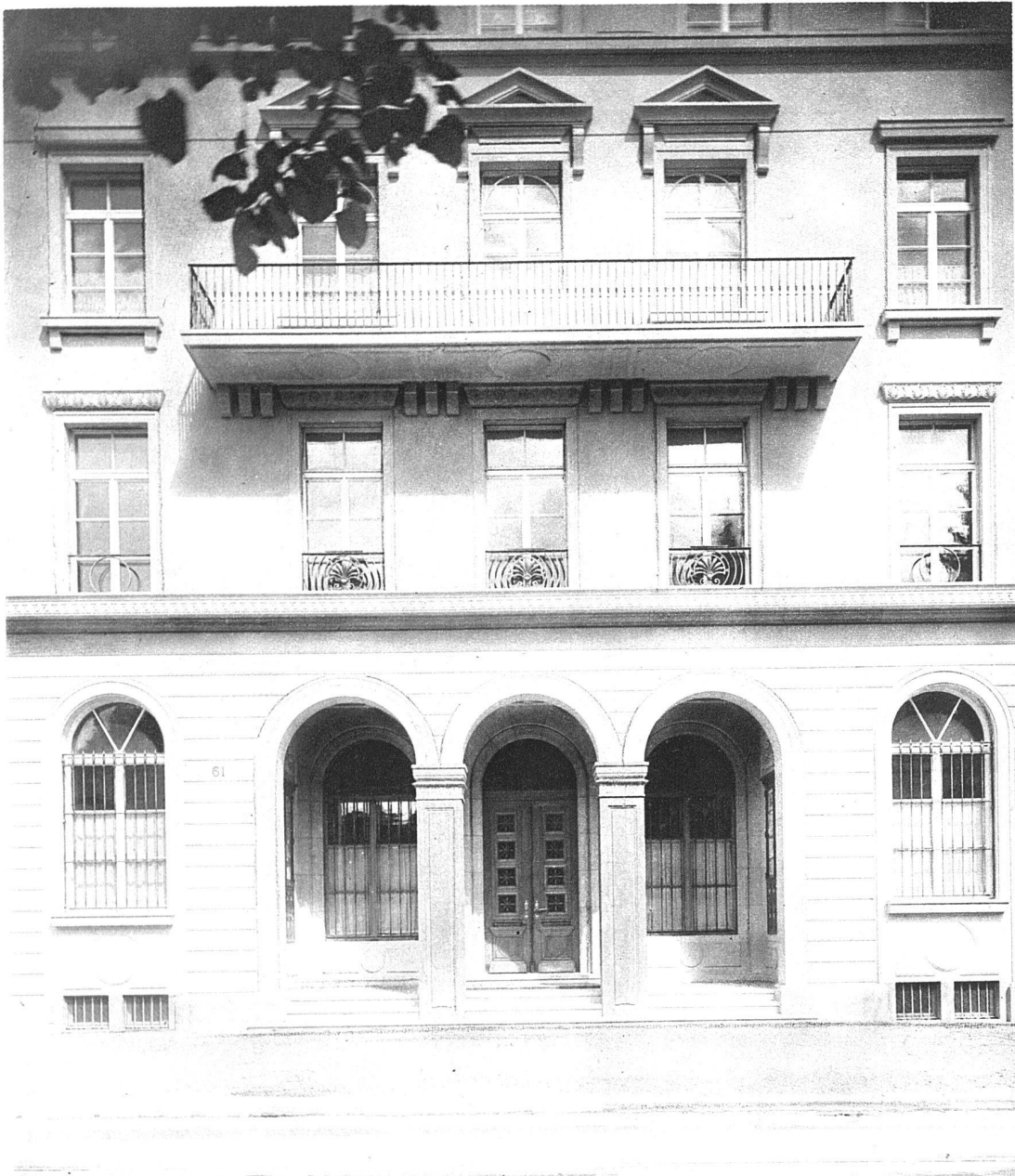
ABB. 4 HAUPTINGANG AM VERWALTUNGSGEBÄUDE