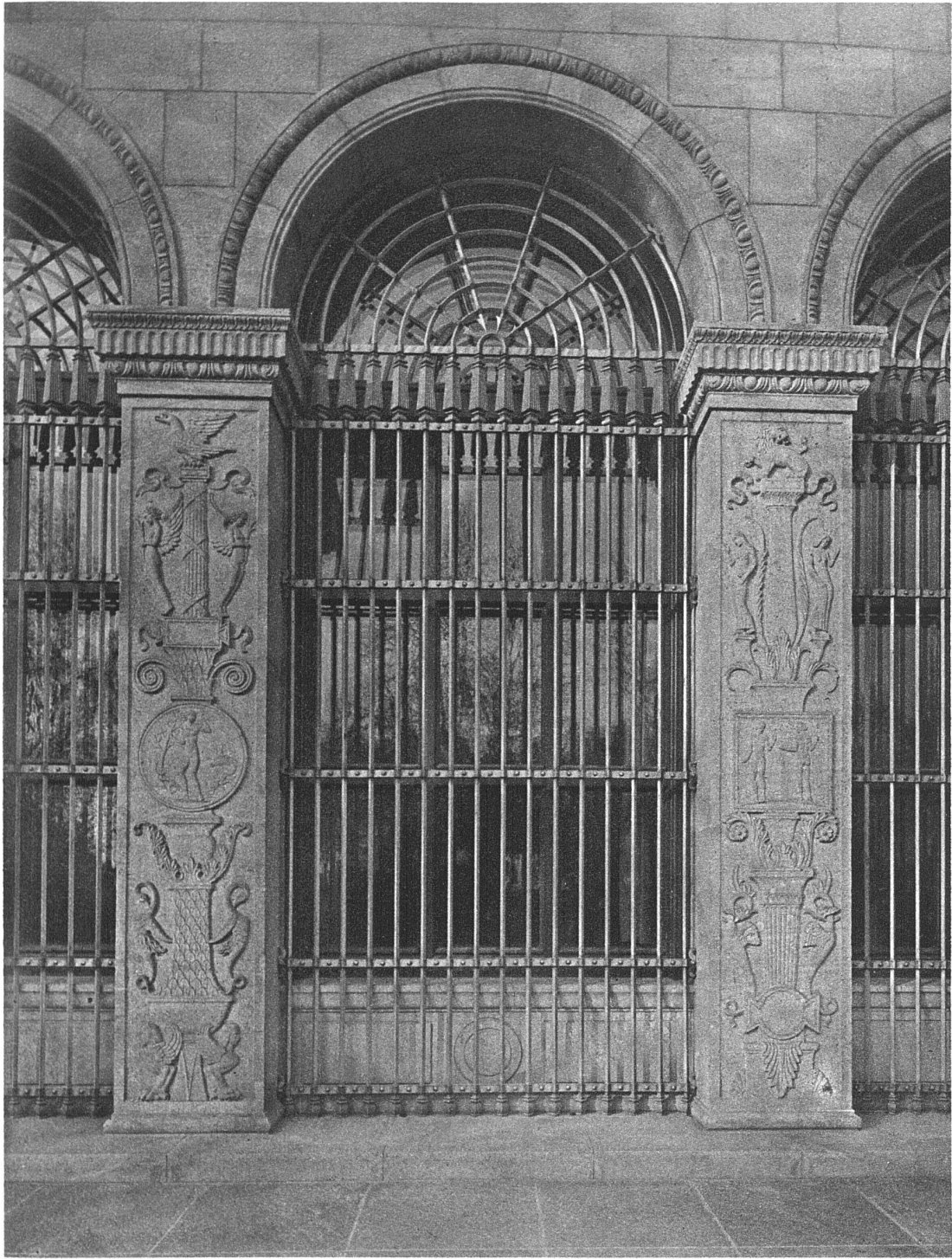
ABB. 16. ARKADE AN DER SEESEITE