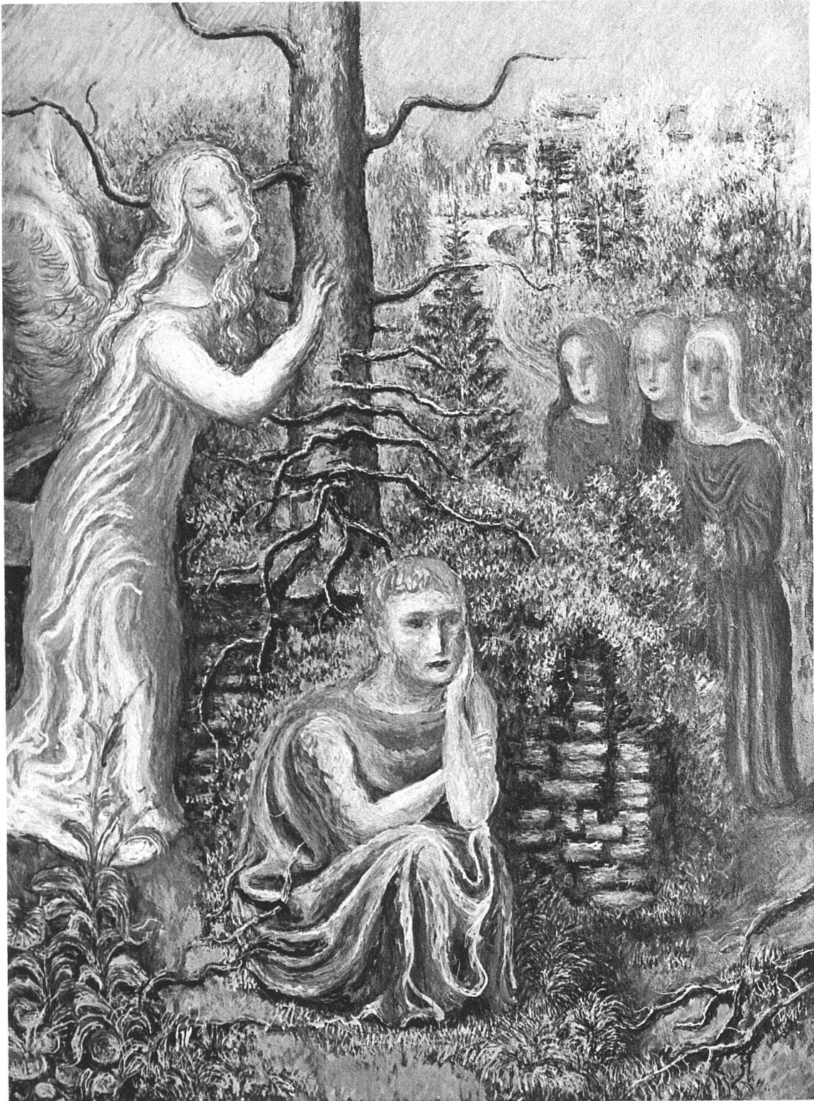
ABB. 20. HERMANN HUBER, KLOSTERS KOMPOSITION