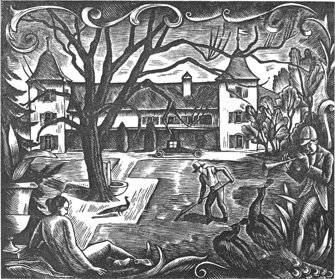
ABB. 19. HENRY BISCHOFF SCHLOSS BREMGARTEN HOLZSCHNITT