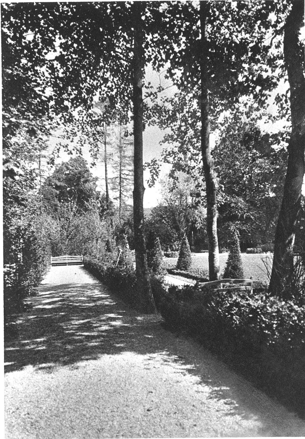
ABB. 14. SCHLOSS BREMGARTEN LINKER HAUPTWEG AUSFÜHRUNG: FROEBELS ERBEN, GARTENARCHITEKTEN, ZÜRICH