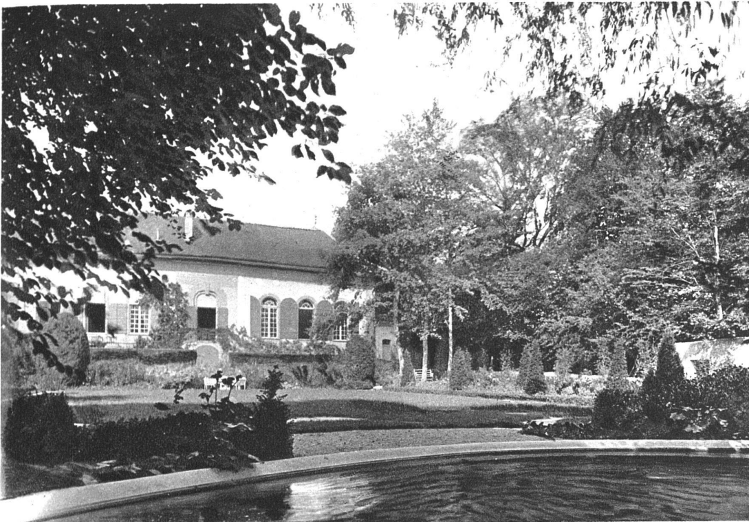
ABB. 18. SCHLOSS BREMGARTEN BLICK VOM BASSIN GEGEN DAS HAUS AUSFÜHRUNG: FROEBELS ERBEN, GARTENARCHITEKTEN, ZÜRICH