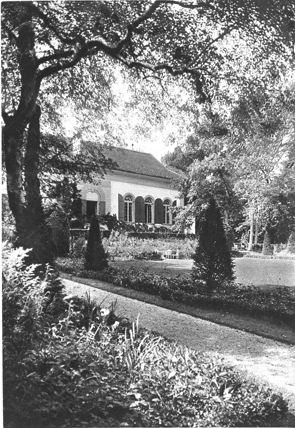
ABB. 15. SCHLOSS BREMGARTEN BLICK GEGEN DAS SCHLOSS AUSFÜHRUNG: FROEBELS ERBEN, GARTENARCHITEKTEN, ZÜRICH