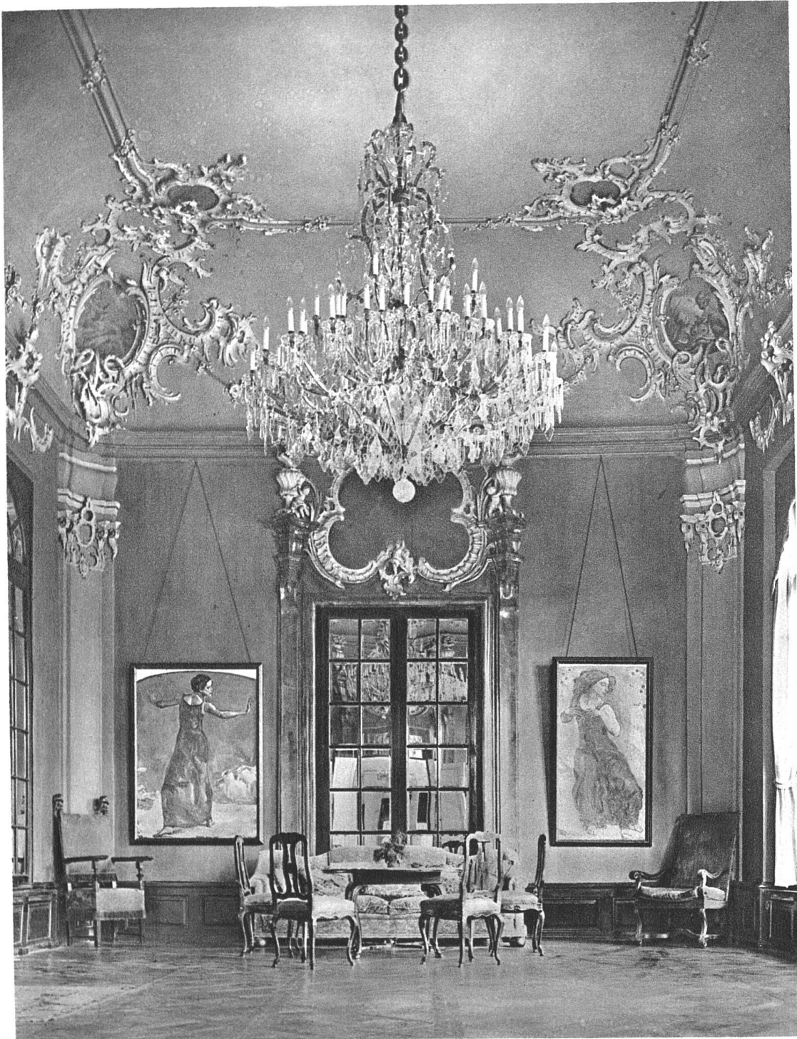
ABB. 20. SCHLOSS BREMGARTEN GROSSER SAAL ENDE DES XVIII. JAHRHUNDERTS