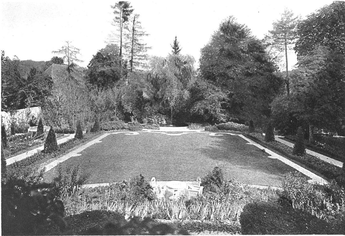
ABB. 16. SCHLOSS BREMGARTEN GESAMTANSICHT DES GARTENS AUSFÜHRUNG: FROEBELS ERBEN, GARTENARCHITEKTEN, ZÜRICH