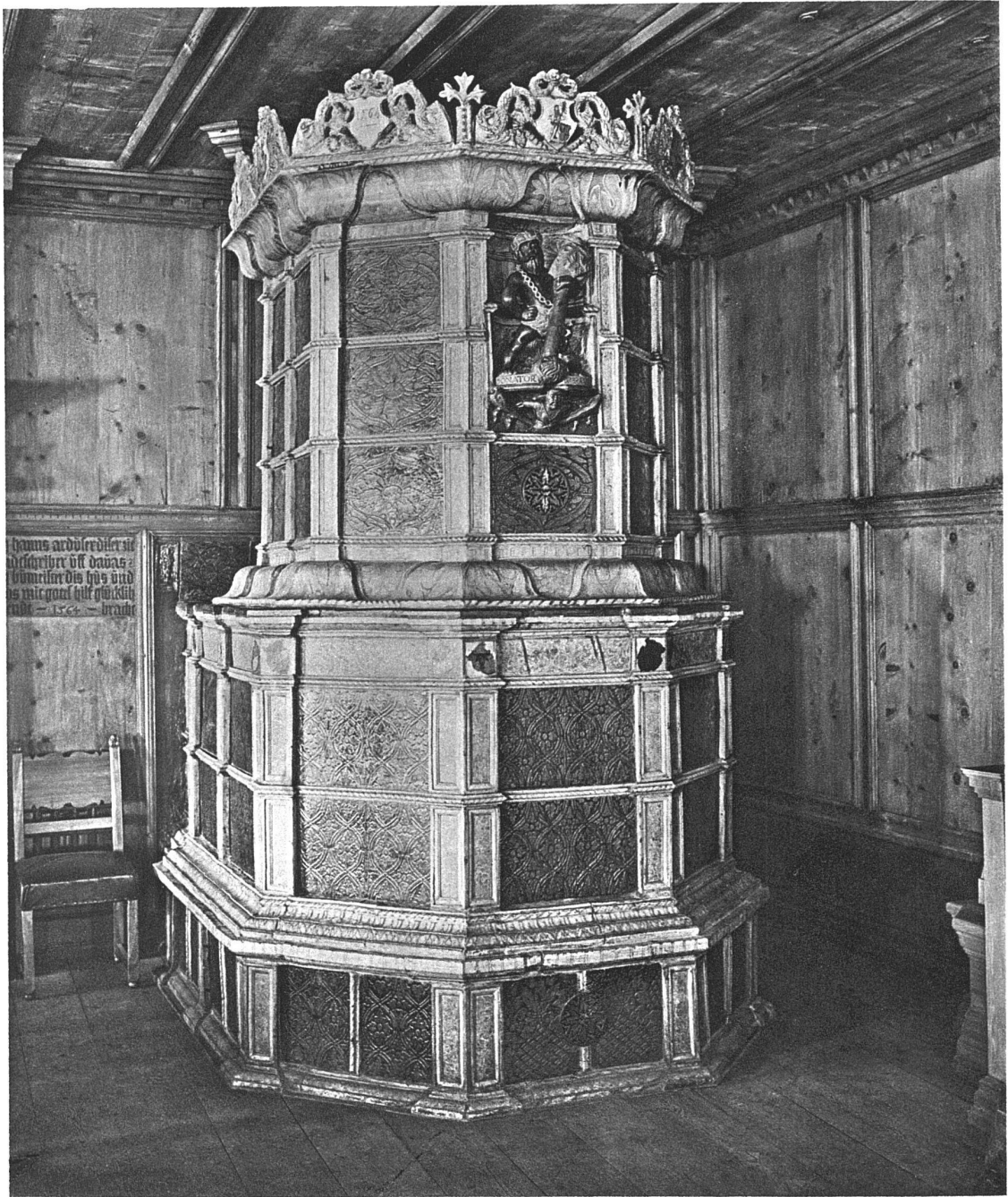
ABB. 9. RATHAUS IN DAVOS, OFEN VON 1564 IN DER „GROSSEN STUBE“, MIT DEM „WILDEN MANN“ VON W. SCHWERZMANN