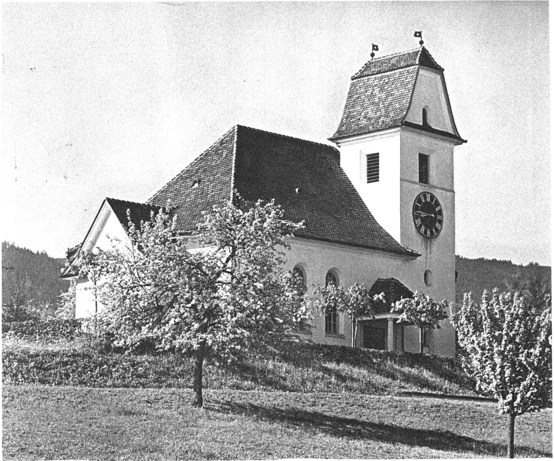
ABB. 14. REFORMIERTE KIRCHE IN WOLLERAU