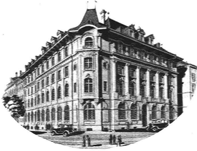
Sitz der Zentralverwaltung in Bern