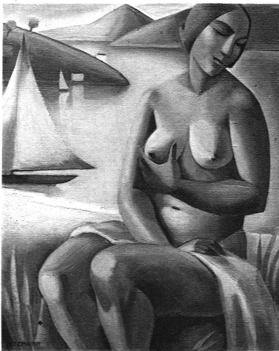
FRAU AM WASSER (1922)