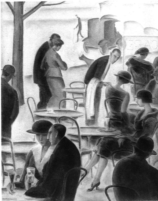
PARISER STRASSENCAFÉ (1922)