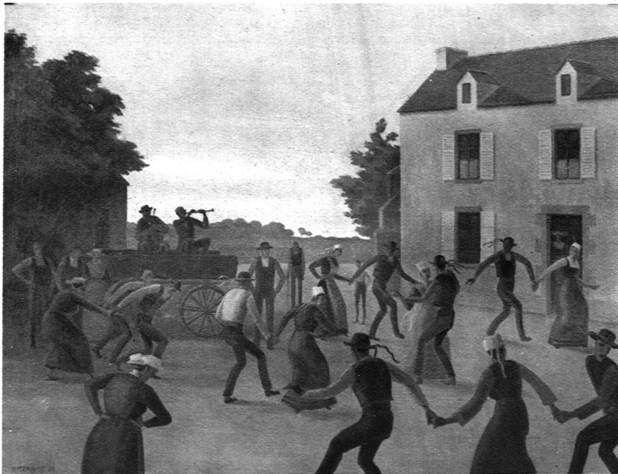
BRETONISCHE HOCHZEIT (1921)