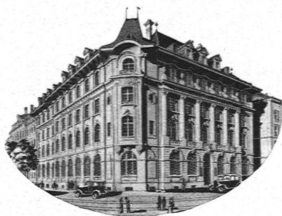
Sitz der Zentralverwaltung in Bern