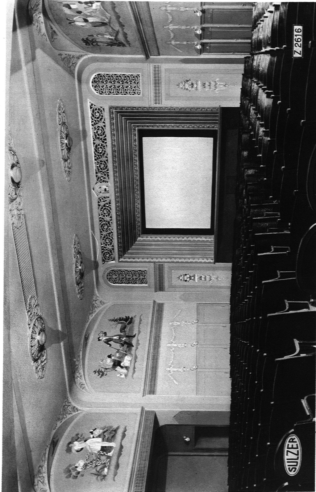
PALACE LICHTSPIELE „BUBENBERG“ BERN WARMLUFTHEIZUNG ausgeführt von GEBRÜDER SULZER, AKTIENGESELLSCHAFT, WINTERTHUR