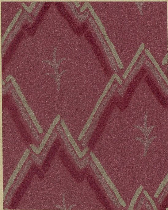
Abb. 1. Muster eines Tekko-Wandbelages. Entwurf H. Weber S. W. B., Basel.

Muster werden in den gleichen Oelfarben, wie sie der Kunstmaler für seine Oelgemälde verwendet, auf eine Pergamentschicht übertragen, worauf das so gemusterte Pergament, ähnlich wie Tapeten, auf die Mauer aufgezo-gen wird. Wie die Tekko, widerstehen auch die Salubra dem Licht, ja sogar den direkten Sonnenstrahlen, auf Jahrzehnte hinaus.