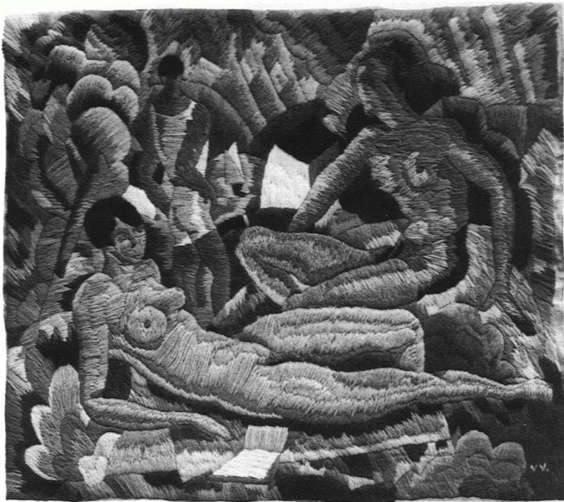
VINCENT-VINCENT / LES JOIES DE L'ÉTÉ Coussin brodé en laine