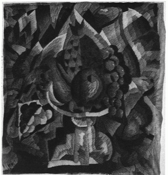
VINCENT-VINCENT, LAUSANNE-NEUCHÂTEL NATURE MORTE Coussin brodé en laine

La cité — le centre — se composera de vingt-quatre gratte-ciels réservés aux bureaux, hôtels, etc. . . et pouvant contenir de 400,000 à 600,000 habitants. A l'entour s'élèveront les maisons d'habitation avec façades à re-dents et séparés par de grands terrains aménagés de façon à ce qu'on puisse faire du sport à sa porte.