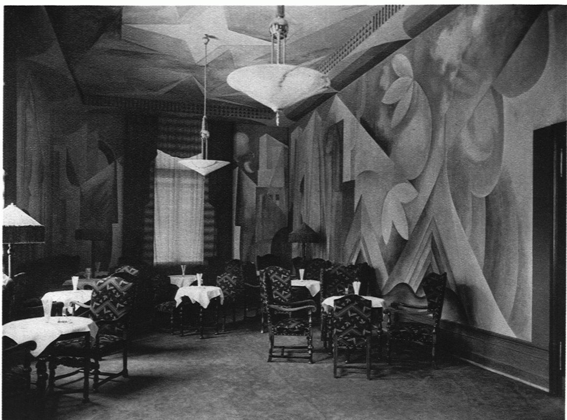
HENAUER & WITSCHI, ARCHITEKTEN B. S. A., ZÜRICH / BAR IM KURSAAL HENNEBERG Malerei von E. Staub, Thalwil

Non sans raison, Le Corbusier fait le procès des appartements tels qu'ils sont aujourd'hui, c'est-à-dire inhabitables. La vraie formule — pour lui du moins — est l'immeuble-villa dont les plans furent également exposés en 1922.