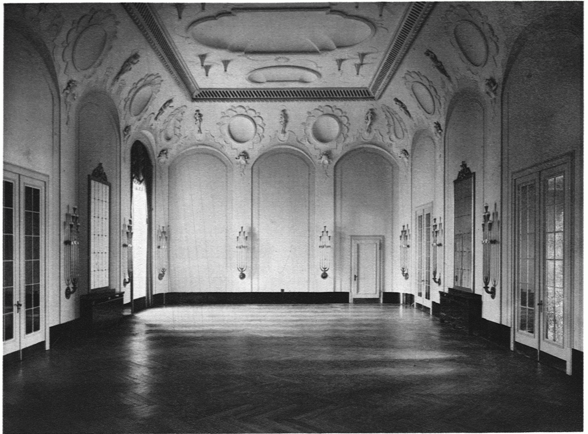
DER FESTSAAL IM KURSAAL HENNEBERG

Architekten: Henauer & Witschi B. S. A., / Dekorative Plastik: Otto Münch S. W. B., Zürich