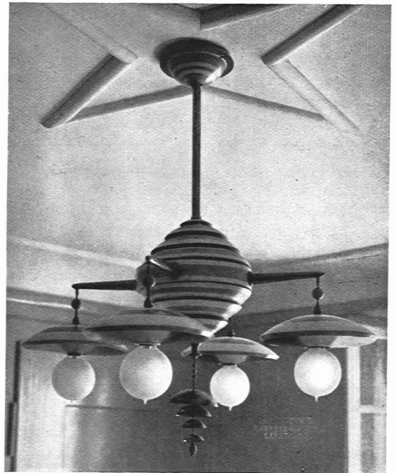
Esszimmerleuchter: blau, weiss und gelb gestrichen: Stiel, Arme und Gehänge in Messing

HANS MÄHLY, ARCHITEKT, BASEL / HAUS ZUM SCHNEGG IN MEGGEN