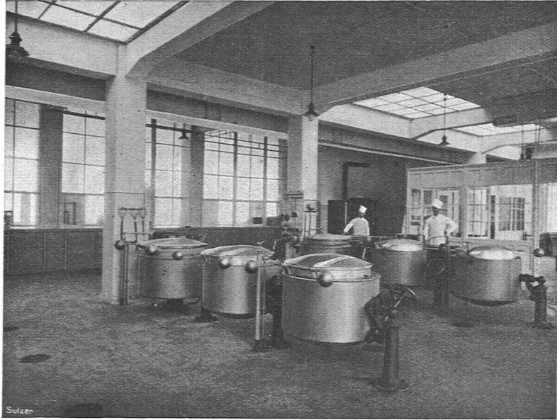
Dampfküche mit 18 Sulzer-Kochkesseln von zusammen 2100 Liter Inhalt, für 0,4 Atm. Betriebsdruck.