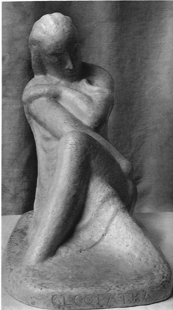
WALTER GYGI Cleopatra (Plastik)

Es bleibt noch übrig, von den Anstalten zur Bewahrung und Hervorhebung der Denkmäler in Alt-Rom selbst zu berichten, die in den neuen Projekten sehr ins einzelne gehen. Es treffen dabei Anregungen von verschiedenen Seiten zusammen; dies ist auch der Tummelplatz aller jener Leute, die glauben, es sei notwendig, um jede Basilika usw. einen grossen viereckigen Platz, womöglich mit Säulenhallen, zu legen. Der offizielle Regulierungsplan ist zurzeit recht gemässigt; er enthält einiges, worüber Nachrichten bereits in die Oeffentlichkeit gedrungen sind, worin Einsicht und Unverstand noch im Wider-