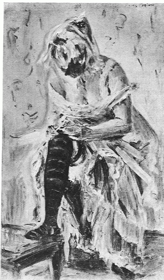
LOVIS CORINTH. Skizze zum „Strumpfband“

fallen« der Aesthetiker? Ach, das meine ist interessiert; es ist auf jede Weise beteiligt — auf jede! Wie könnte es anders sein? Man sagt, die Kunst sei der höchste Ausweis des Menschlichen. Aber vielleicht steht es umgekehrt: das Menschliche ist der höchste Ausweis der Kunst — jenes Menschliche, das in keiner Gestalt dem ganzen Menschen und Künstler fernbleiben kann. Mir scheint: dies Bild ist mehr als Kunst; es bricht aus der Leinwand hervor wie der stossende, puffende Rauch aus dem Vesuv; es ist das treibende und zerstörende Leben selbst, das nichts für sich kann; es ist die überschüssende Natur in Person; es ist die naive Trunkenheit des Daseins, und die Kunst der Malerei wird von dieser Trunkenheit gerade nur mehr umschlossen. Ist es so? In dieser Sekunde sehe ich das Genie des Malers über seine männlichen Begierden hinausbranden wie den Ozean über das krause Gestade; mit wunderbarer Souveränität bewegt sich die