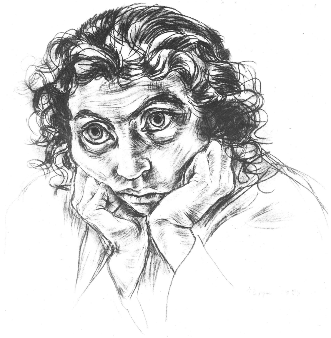
IGNAZ EPPER Meine Frau (Kreide, 1924)