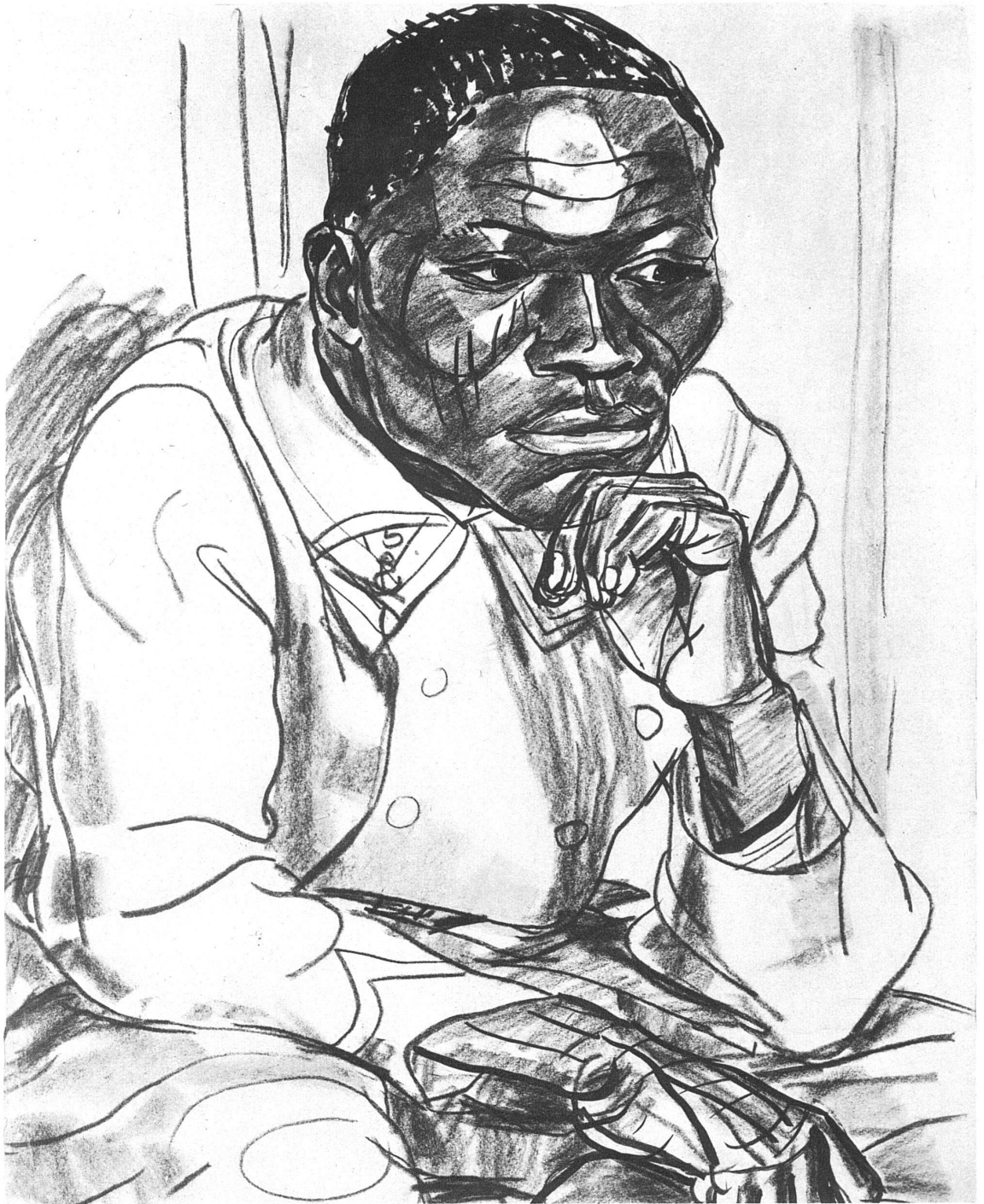
IGNAZ EPPER Sudanegersoldat (Kreide und Tusch, 1925)