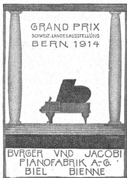
PARIS 1925 GOLDENE MEDAILLE

Dauer: 3 bis 4 Wochen ab 16. Mai • Nähere Angaben durch V. S., Schwarztorstr. 61, Bern