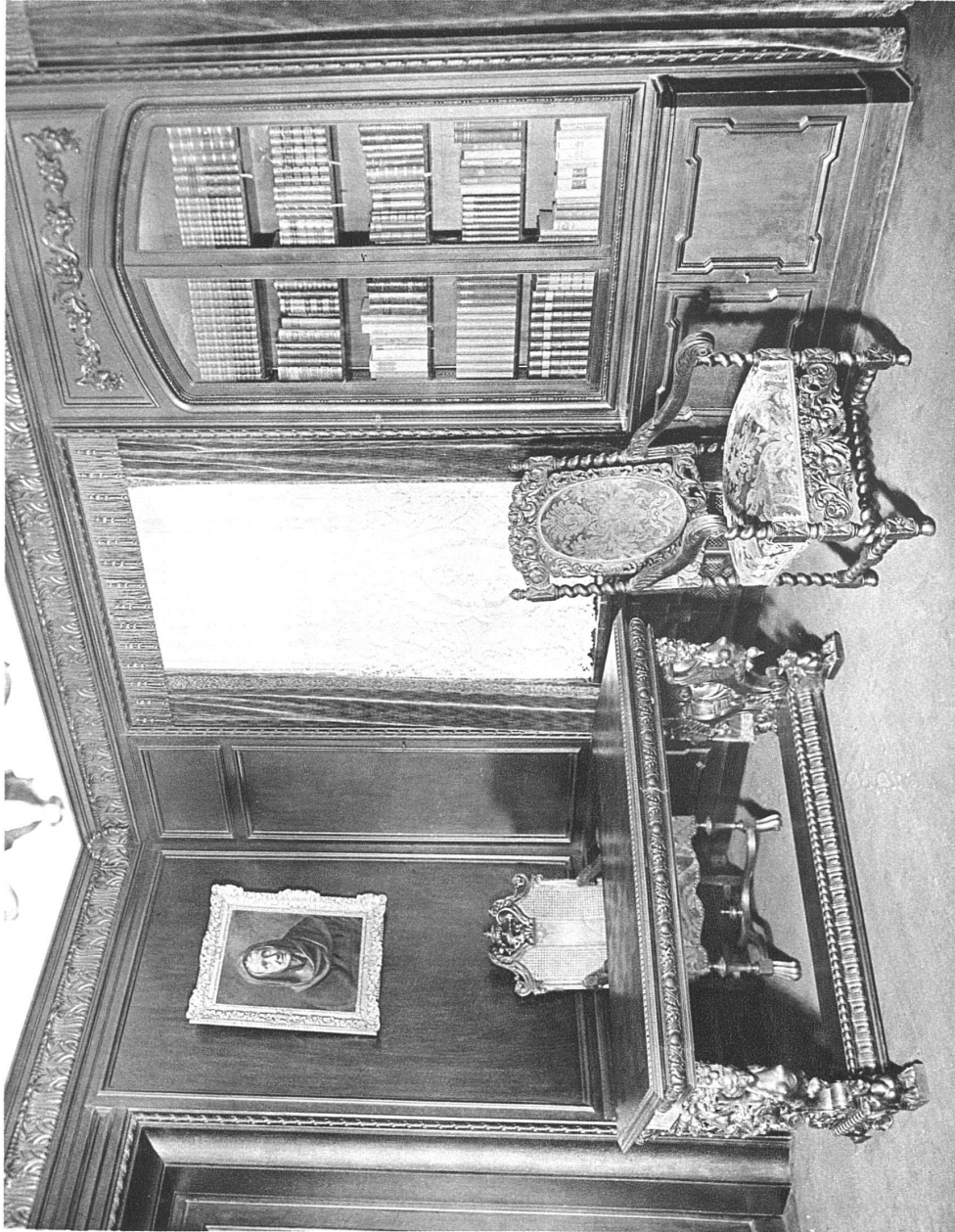
Intérieur aus einer Villa in Zürich