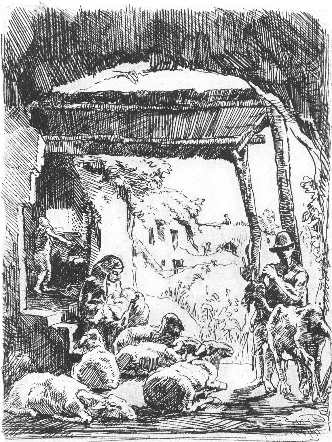
GERTRUD ESCHER, ZÜRICH / AUS »GIDEON«