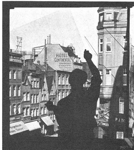
Scharf und formenklar ist dagegen die Aussicht durch eine Kristall- Spiegelglasscheibe Marke A.M.G.E.C.

Unser modernes architektonisches Empfinden, sowie unser Streben nach Licht und Luft gewährender Gestaltung der Wohn- und Arbeitsstätten zwingen den auf Besserung der Volksgesundheit bedachten Architekten zum Bau grosser Fensteröffnungen und damit zur weitgehendsten Verwendung von