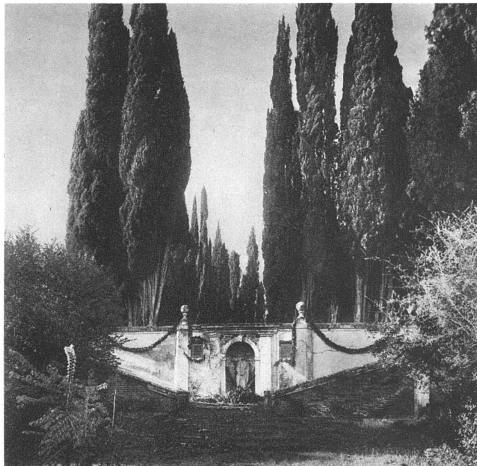
VILLA FALCONIERI IN FRASCATI