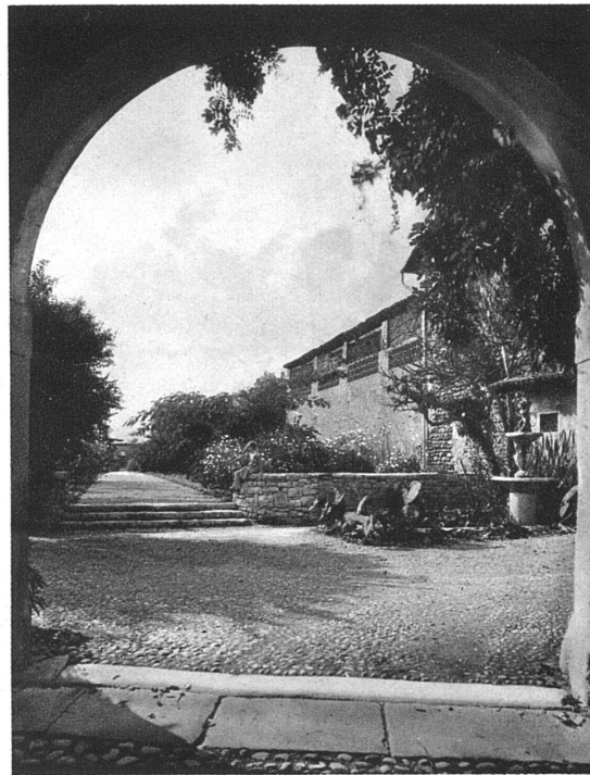
Blick aus dem Hof auf den obern Weg

ein Feld von ungefähr 8000 m 2 Fläche, das nach Auflassung mehrerer Wegrechte und Servitute der gärtnerischen Bebauung freistand (siehe den Situationsplan). Die Elemente der planmässigen Aufteilung sind im wesentlichen folgende: ein in der Längsrichtung durchgeführter Weg teilt das Gelände in zwei ungleiche Hälften, die ihrerseits wieder durch einen rechtwinklig zum ersten angelegten Querweg unterteilt werden. Im Schnittpunkt der beiden Wege steht die grosse Pergola und das Badebassin. Von den beiden kleineren Kompartimenten zunächst den Oekonomiegebäuden (Nordseite) wurde das erste im wesentlichen für Beete und Rabatten, das zweite für den Tennisplatz reserviert. Ein breiter, abwechselnd von Allee-Bäumen und immergrünen Büschen eingefasster Weg führt vom Herrenhaus her an den Oekonomiegebäuden vorbei zum Tennisplatz; er bezeichnet die höchste Stelle im Garten, da von ihm aus das Gelände zum Oglio hin leicht abfällt. Die beiden andern Kompartimente sind der sehr grosse «Brolo», eine freie, mit wenigen Bäumen bestandene Wiese, und dahinter der Gemüsegarten. Im Blickpunkt des mittleren Längsweges steht das ebenfalls von Froebel neu gebaute Tennishaus, und hart am Rande des Oglioabhanges führt ein Weg