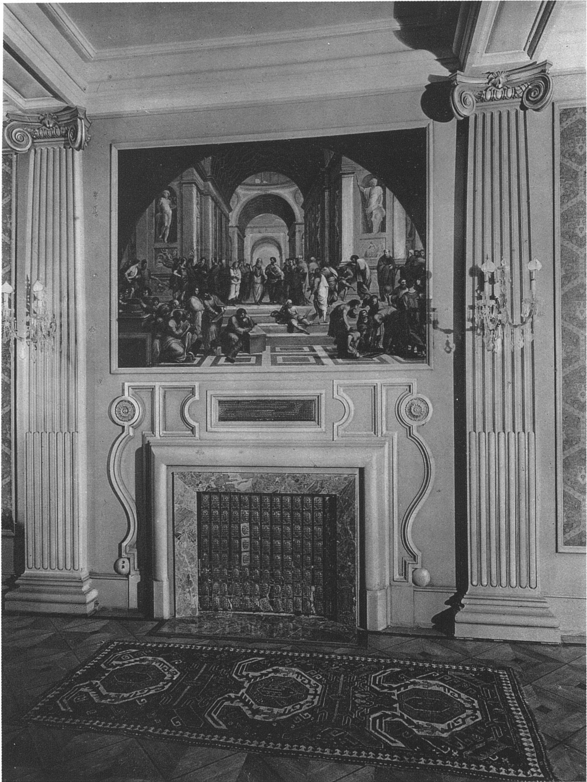
Cheminée-Partie in der Halle des Grand Hotel Palace, Lugano Schleiflack grünlich