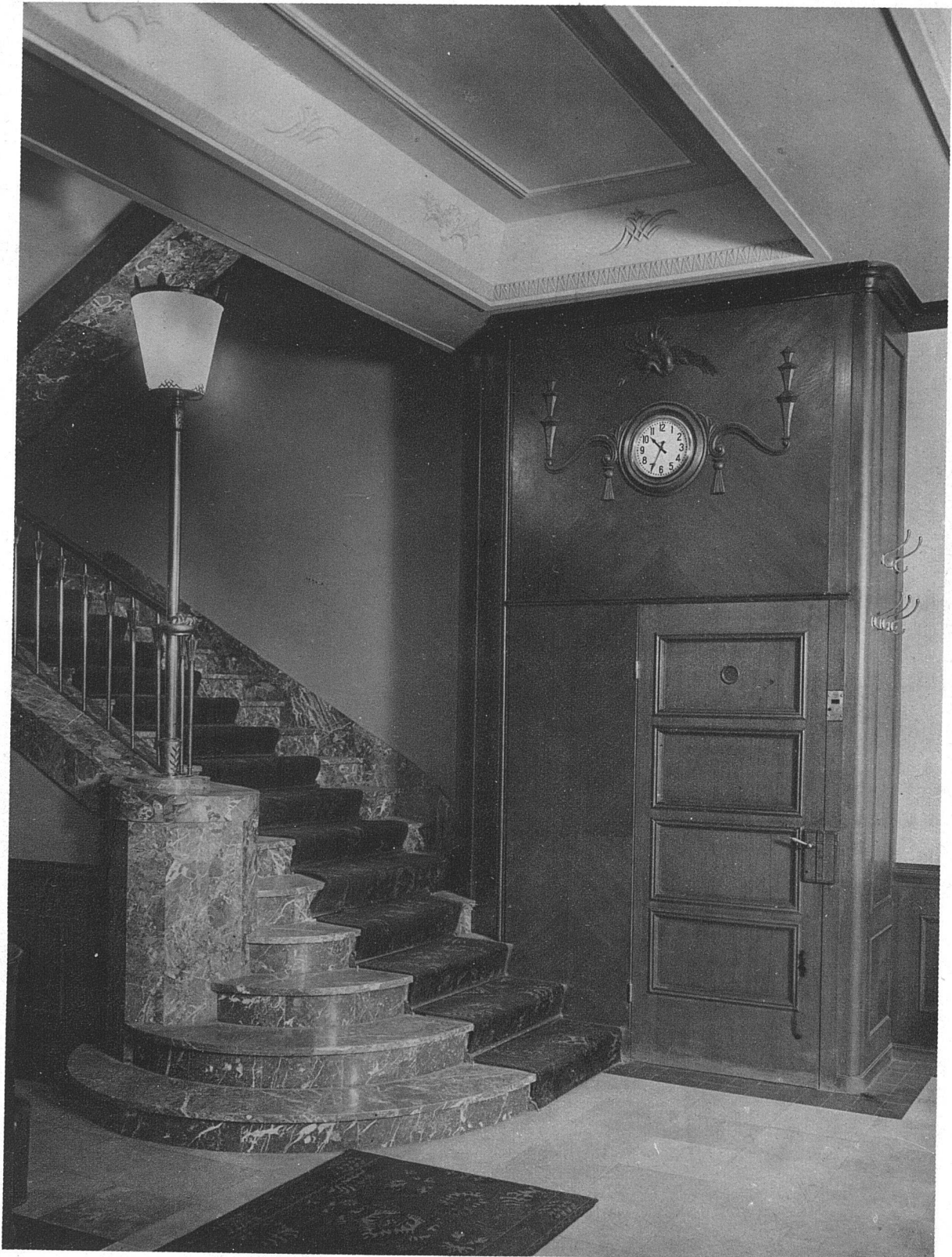
Liftverkleidung im Stadthof-Posthotel Arch. Gust. v. Tobel