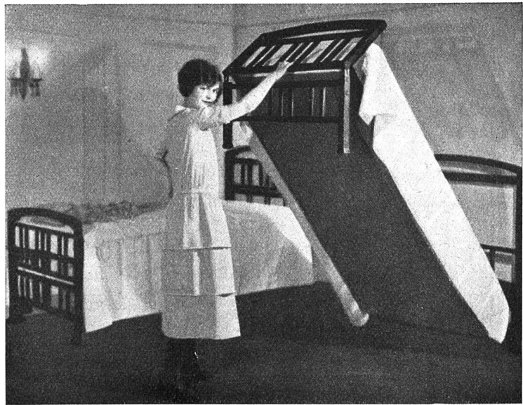
11 / Das Klappbett lässt sich ohne jede Anstrengung aufstellen