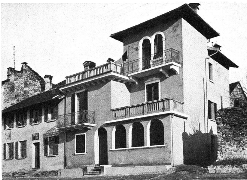
NEUERE BAUTEN »LOMBARDISCHER STIL« IN ASCONA UND LOCARNO

Architekt Keller in Bern stellt uns als Illustration zu