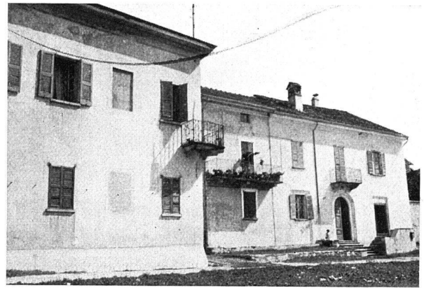
ÄLTERE WOHNHAUSBAUTEN IN ASCONA