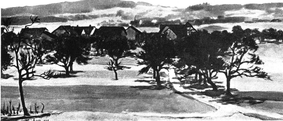
HANS BÜHLER, NEUHAUSEN / LANDSCHAFT / 27 × 39 cm