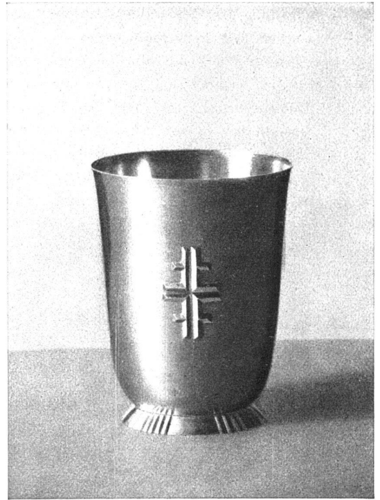
BECHER / C. J. JUCKER, SCHAFFHAUSEN