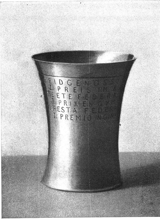
BECHER / JULIUS SCHWYZER, ZÜRICH