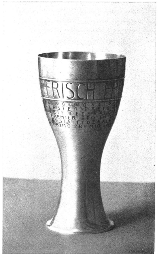
POKAL / JULIUS SCHWYZER, ZÜRICH