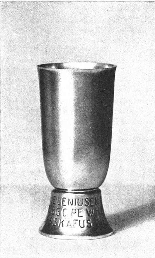
POKAL / PAUL PILLOUD, ST. GALLEN