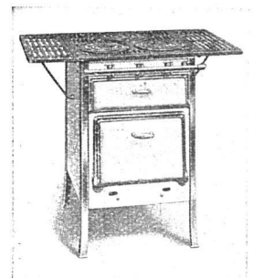
Gasherde Gella mit 3 Kochstellen oder Gellis mit 4 Kochstellen