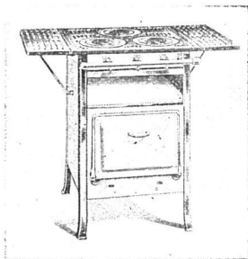
Volksherd mit 3 od. 4 Kochstellen

Sie sind das Vollkommenste, was heute auf diesem Gebiet existiert