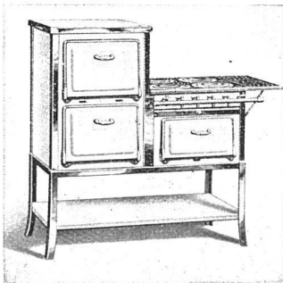
Der moderne Familien-Gasherde mit hochgebautem Bratofen

Wir fabrizieren für jeden Bedarf das richtige Modell, vom einfachsten bis zum luxuriösesten Familienherd, für Klein-Familien, Villen, Sanatorien, Pensionen, Hotels, Restaurants, Institute und Krankenhäuser.