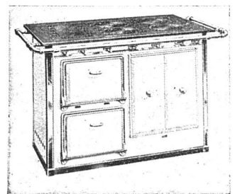
Der moderne Gasherde für Herrschaftsküchen, ausgerüstet mit allen Chikanen