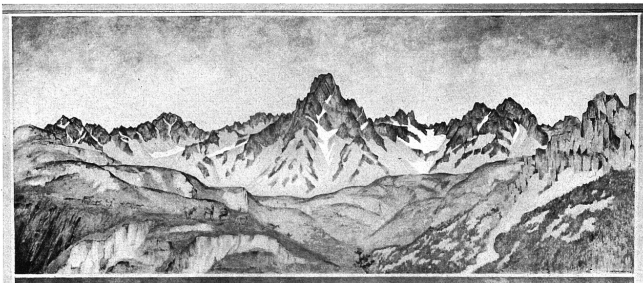
GIOVANNI GIACOMETTI / MITTELBILD, 7,00 × 3,20 m / PIZ PLAVNA