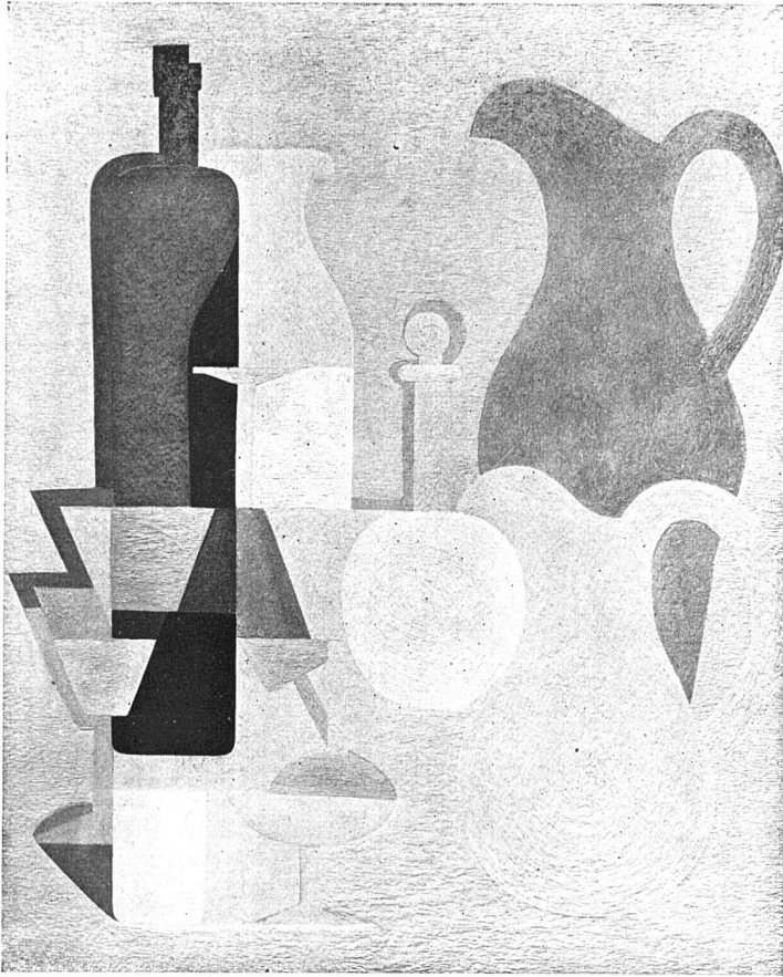
AMÉDÉE OZENFANT NACRE, 65, 81

auch der Belgier Margritte mit seinen dumpf klingenden Ockerflecken auf grauem Grund?