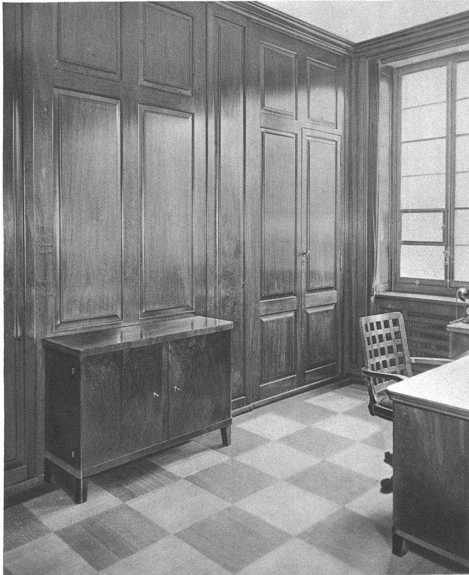
Verwaltungsgebäude N. O. K. Baden • Direktionszimmer in Nussbaumholz Architekten Gebr. Pfister, Zürich

ALFRED HÄCHLER S. W. B. • SCHREINEREI-WERKSTÄTTEN • LENZBURG