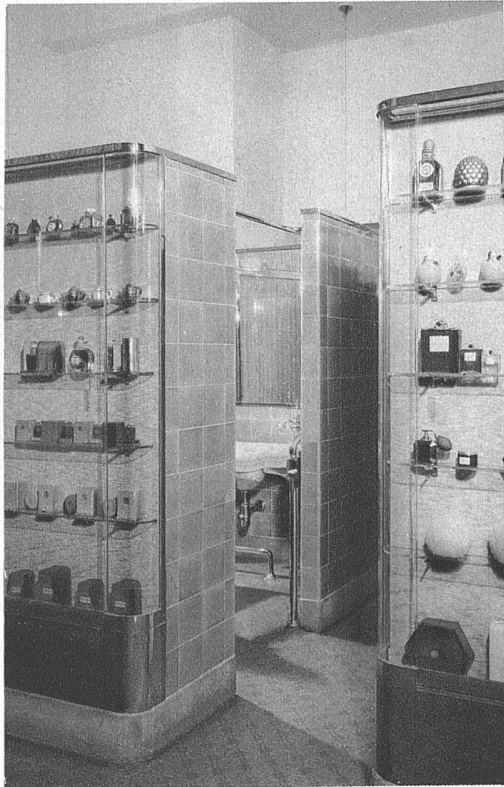
Coiffeurgeschäft Bachmann an der Poststrasse, Zürich Arch. J. Graf, Niederurnen (Glarus)