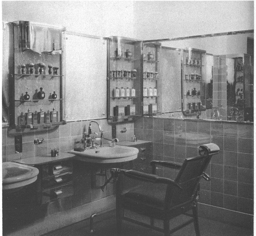
Coiffeurgeschäft Bachmann, Zürich Arch. J. Graf, Niederurnen (Glarus)