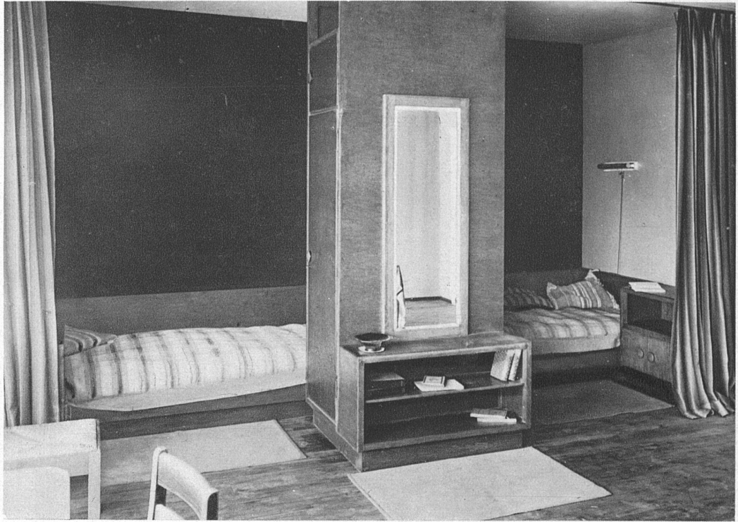
Innenräume des Teatro San Materno, Ascona Architekt Carl Weidenmeyer Kombiniertes Wohn- und Schlafzimmer Wände blau, Decke hellgelb, Bettwand schwarz, Holzteile goldbraun, Vorhänge gelb, orange, rot gestreift