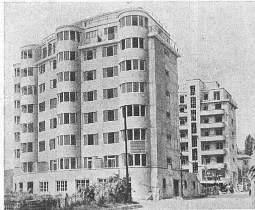
Vue de la rue Charles Giron

Depuis quelques semaines, les travaux sont commencés et les soumissions ont été ouvertes pour les gros travaux et aussi pour certains autres travaux de détail qu'il est nécessaire de prévoir en temps utile. Les soumissions devaient être reçues au plus tard le 20 octobre