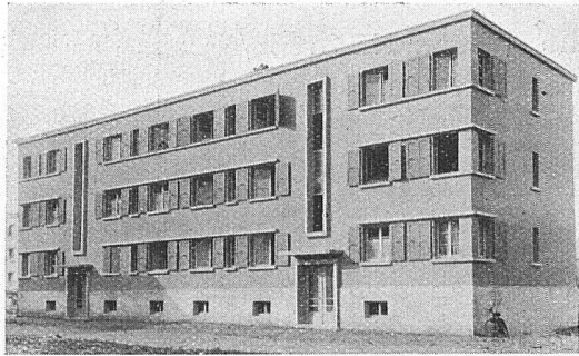
La cité-jardin du Bachet-de-Pesay, Genève (en construction) Dosso et Perrin, architectes

L'implantation des bâtiments est remarquable: toutes les chambres sont bien orientées. Elles ont le soleil, soit le matin, soit l'après-midi. Les fenêtres sont assez grandes; les escaliers sont éclairés par de longues baies verticales; les bâtiments sont couverts en terrasse. Certes, les façades