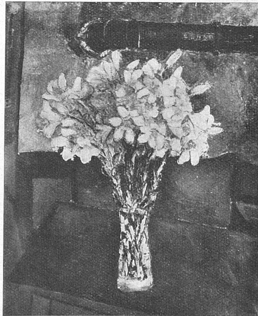
Helen Dahm, Oetwil Lilien

Die Galerie Forter ist vom Hechtplatz nach dem nicht weit entfernten Hause Sonnenquai 16 umgezogen, wo die Mitbeteiligung der Raumkunstfirma Betz die Inanspruchnahme des Erdgeschosses und des Entresol ermöglichte. In dem gediegen ausgestatteten Raum zu ebener Erde können zahlreiche Bilder dem raumkünst-