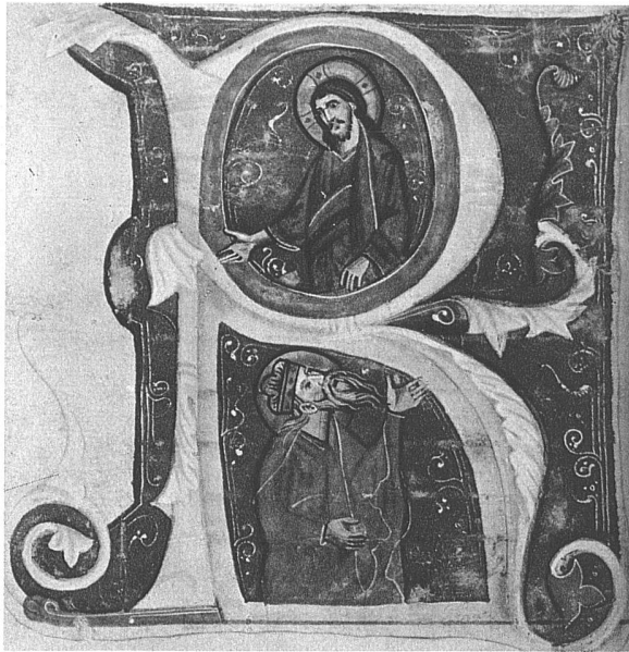
Initiale R Christus und David Norditalien, XIII. Jahrhundert (Toesca XX)