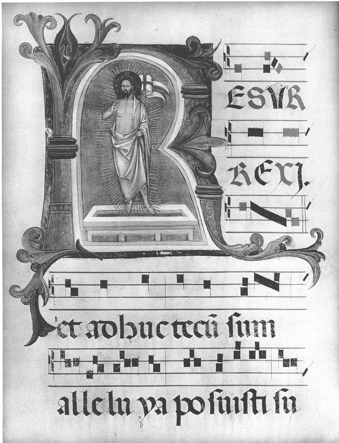
Blatt aus einem «Corale», Initiale R mit Auferstehung Christi Florenz, Mitte des XV. Jahrhunderts (Toesca CXXXIII)