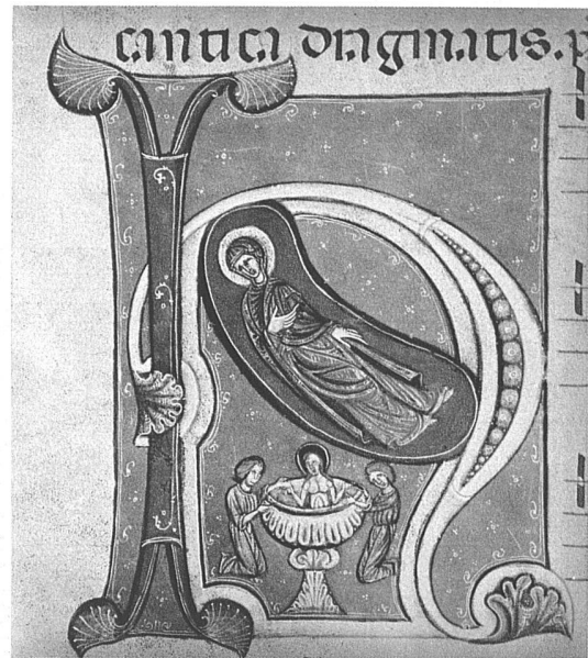
Initiale H Christi Geburt Mittelitalien, XIII. Jahrhundert (Toesca XII)

den ornamentierten Gegenstand einbezieht, er manifestiert seine Zugehörigkeit zu einer kulturellen Gruppe. Gerade in dieser Hinsicht hat das klassische, antik-griechische Ornament seine Rolle auch heute noch lange nicht ausgespielt, und die Ornamentlosigkeit bedeutet auch nichts anderes als die Manifestierung einer bestimmten Gruppen-Konvention, eine «Anti»-Bewegung, die von ihrem Gegenteil lebt wie der Antialkoholismus vom Alkoholismus.