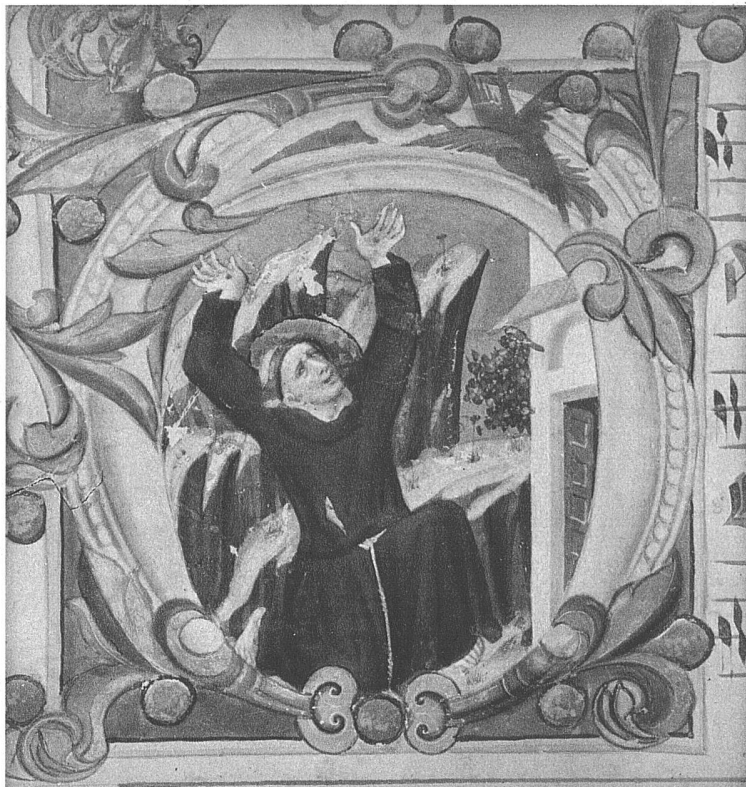
Initiale mit der Stigmatisation des hl. Franz Siena, Mitte des XIV. Jahrhunderts (Toesca LXIV)

Das alles ist sozusagen mittelalterlich gesagt und für den modernen Leser gerade dieser Zeitschrift vielleicht befremdlich. Es wird sich aber doch lohnen, die Sache auch einmal von dieser Seite anzusehen, die unbewusstermassen in jeder Art von Ornament und — in Form der Negation — von Ornamentlosigkeit auch heute mitenthalten ist. Denn in diesen Ueberlegungen findet gerade auch die moderne Ornamentlosigkeit ihre Rechtfertigung: wo keine formalen Konventionen mehr lebendig sind, kann auch der Ausdruck solcher Konventionen nicht beibehalten werden. Wenn sich allerdings aus dem heutigen Durcheinander erst wieder kulturelle Einheiten zusammenschliessen, so wird sehr wahrscheinlich auch wieder ein organisches Bedürfnis nach Ornament auftreten, und wenn in der Zwischenzeit einige Formenreihen aus persönlichem Ausdrucksbedürfnis einzelner Künstler, und andere aus primitivem Prunkbedürfnis der Verbraucher weiterlaufen, so besteht schliesslich keine Notwendigkeit, sie mit weltanschaulichen Knüppeln totzuschlagen. Denn organische Prozesse — und um solche geht es hier — lassen sich weder aufhalten noch beschleunigen.