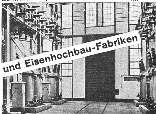
Zentrale Rempen der AG. Kraftwerk Wäggitäl

Verband Schweiz. Brückenbau- und Eisenhochbau-Fabriken Zürich, Biberlinstrasse 38, Telefon 43.071