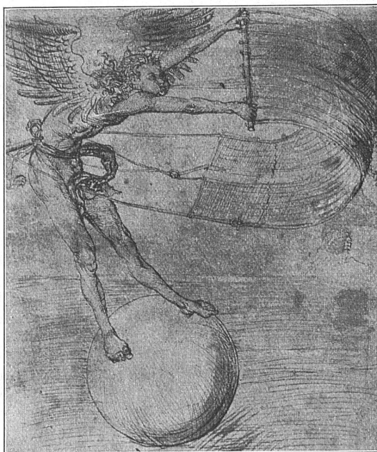
Aus Elfried Bock : Die Zeichnungen in der Universitätsbibliothek Erlangen

Dieses mit dem ganzen bibliographischen Apparat ausgerüstete prachtvollste Foliowerk verspricht ein wahrer Thesaurus des deutschen Buchholzschnittes zu werden. Natürlich kann dieses Werk nicht auf absolute Vollstän-