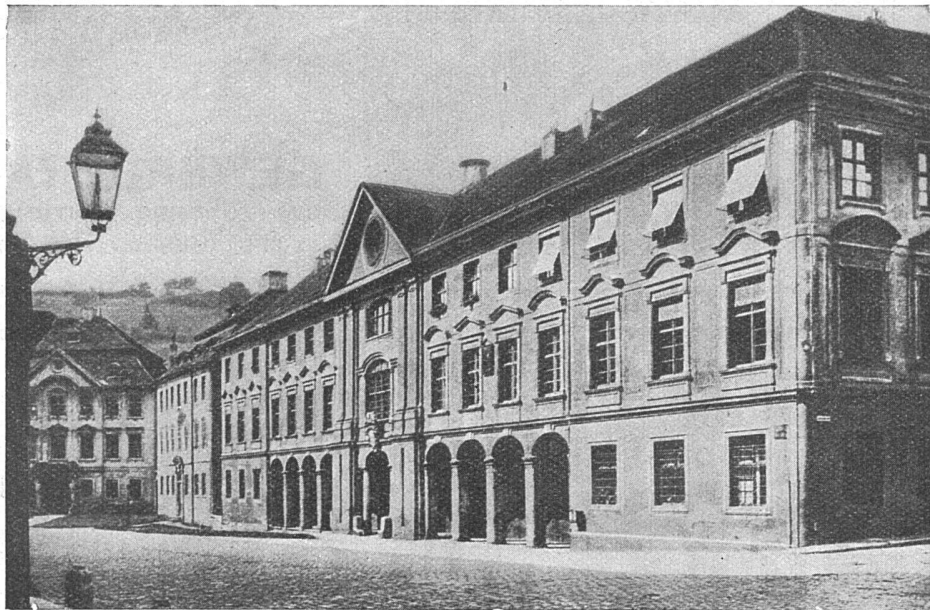
EICHSTÄTT. EHEMAL. FÜRSTBISCHÖFLICHE KANZLEI (BEZIRKSAMT) 1728 GABRIEL DE GABRIELI

Verkleinerte Abbildung aus „Zentralli, Graubündner Baumeister“