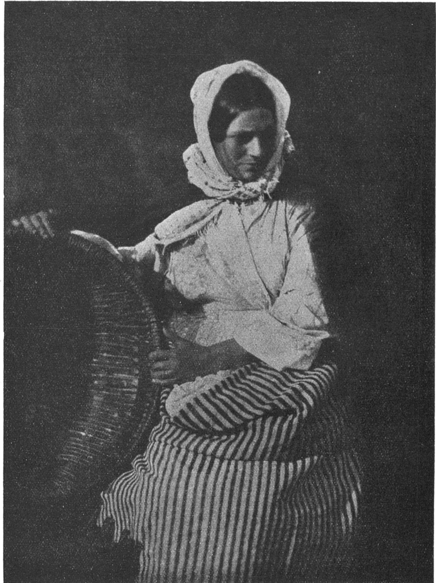
Fischverkäuferin aus Newhaven